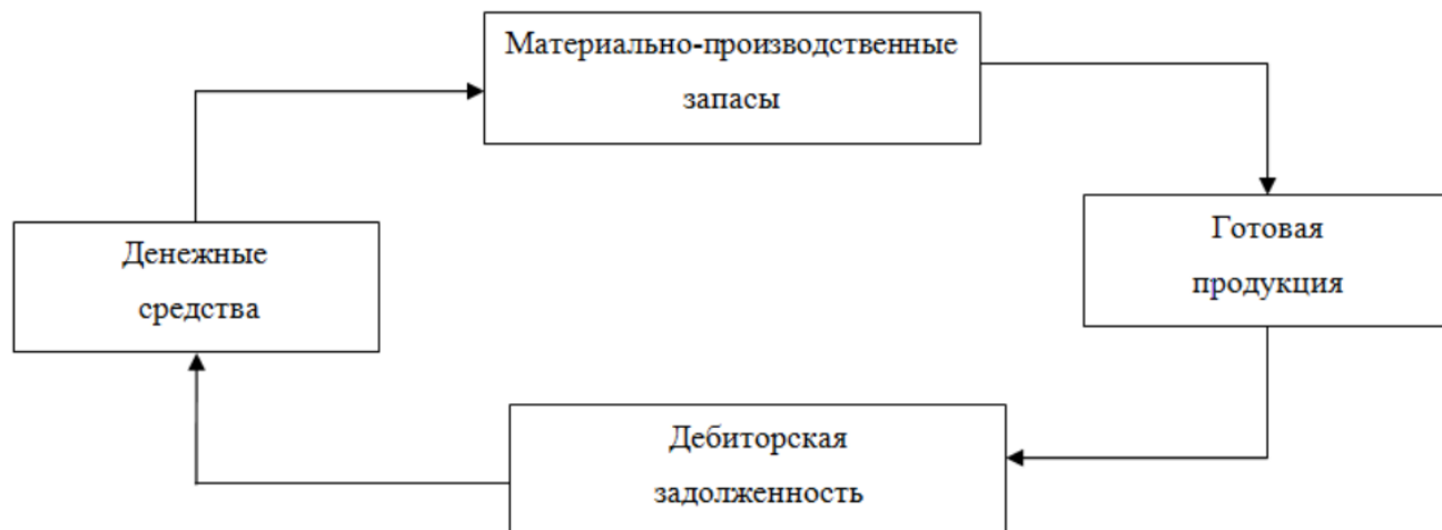
Рисунок 2 – Кругооборот оборотного капитала коммерческой организации

Одной из ключевых особенностей оборотного капитала является то, что он не расходуется и не потребляется, а авансируется в ходе производственного процесса, т.е. совершает кругооборот (рисунок 2).